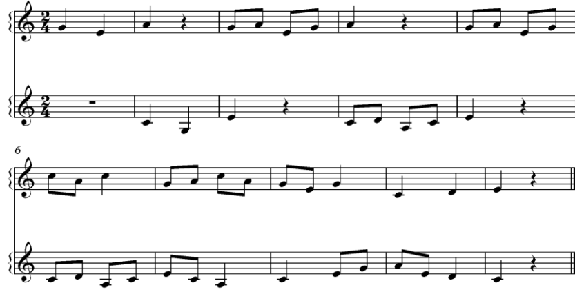
شكل (٢) مثال يوضح الغناء التبادلي عند كوداي ١