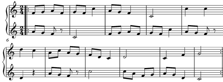
شكل (١) مثال يوضح الغناء بطريقة الصدى عند كوداي ٣

وهو نوع من التمرينات المونودية، ولكن ينقسم الصف إلى مجموعتين تغني احدهما اللحن بصوت قوي Forte وتردده المجموعة الثانية بصوت لين "Piano"، والغناء بطريقة الصدى يجذب الانتباه مبكرا إلى ظلال التعبير "Nuance Dynamic" ٢